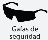
Gafas de seguridad